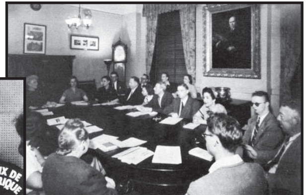
Klub-kunveno en Novjorko en 1953.