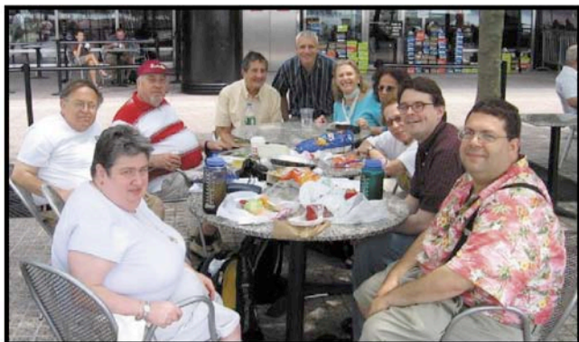
ESNY piknikantoj en la Vintra Ĝardeno.